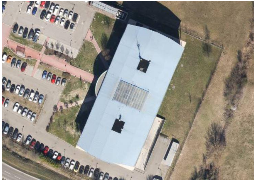
Immagine 1. La copertura della sede della Polizia Locale di Modena. Vista aerea.

La copertura in lamiera grecata da 10/10 di mm della sede principale della Polizia Locale di Modena attualmente non dispone di un accesso diretto il che rende particolarmente difficoltoso l'ispezione della copertura stessa e la effettuazione delle normali operazioni di manutenzione ordinaria e straordinaria.