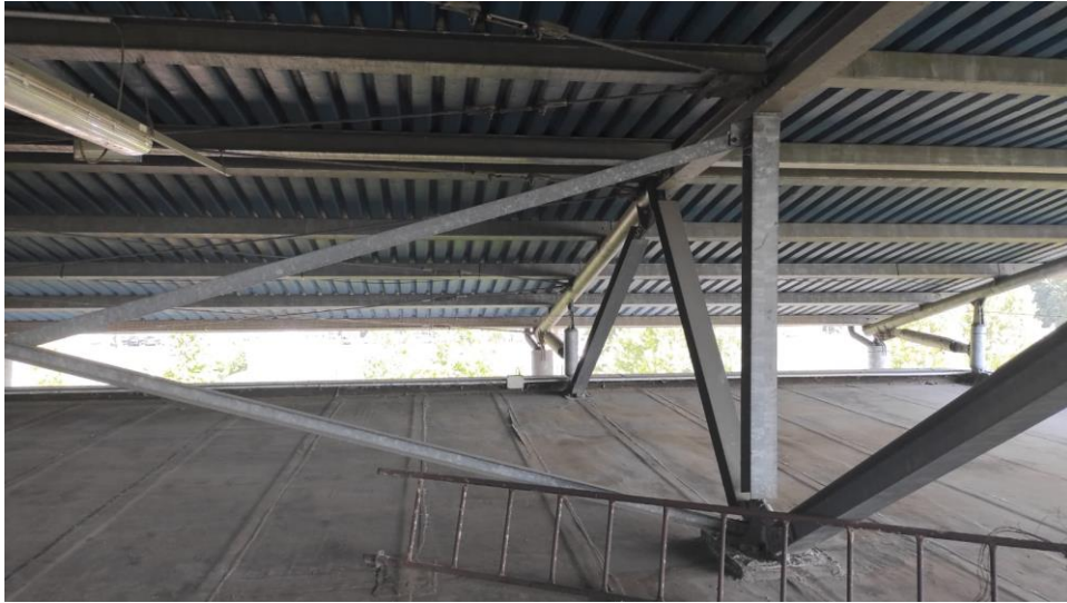
Immagine 3. La copertura in lamiera grecata. Vista della parte inferiore verso il solaio di copertura.